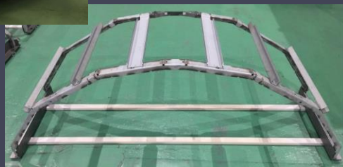
CTスキャン アーチ型 フレーム