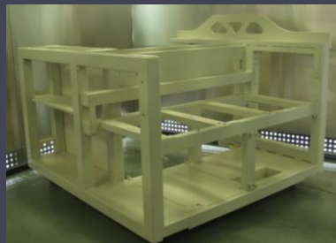
半導体製造装置用 フレーム